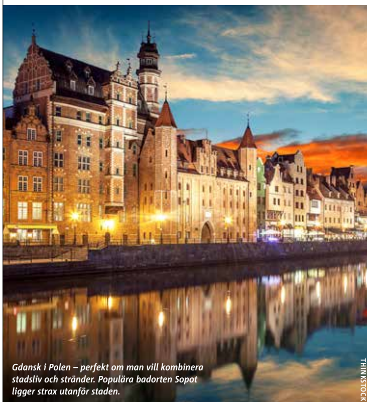
Gdansk i Polen – perfekt om man vill kombinera stadsliv och stränder. Populära badorten Sopot ligger strax utanför staden.